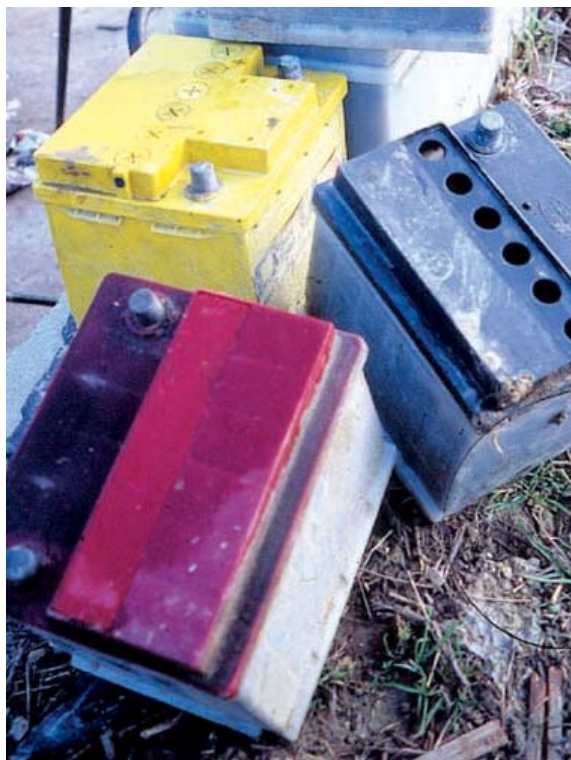
Anche le batterie d'auto contengono sostanze pericolose che devono essere trattate e smaltite correttamente.