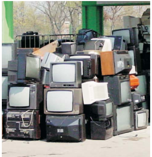
Rifiuti di Apparecchiature Elettriche ed Elettroniche.

Ogni categoria racchiude un elenco di prodotti (allegato I B) che devono essere presi in considerazione ai fini della presente Direttiva e che rientrano nelle categorie dell'allegato I A: