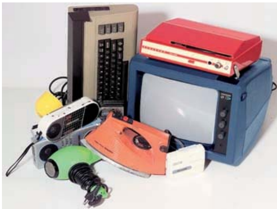
Alcuni materiali che sono compresi nell'elenco dei R.A.E.E secondo la direttiva 2002/96/CE.